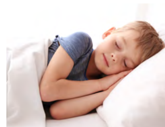
Silenzioso al 100% Completely silent

Dati rilevati con temperatura ambiente di +25°C/77°F secondo la norma CEI EN 62552:2013. Indel B si riserva il diritto di modificare le caratteristiche tecniche e di design senza preavviso. Frigoriferi con temperatura moderata non adatti per la conservazione di alimenti freschi. Above data detected with room temperature of +25°C/77°F according to CEI EN 62552:2013 specifications. Indel B reserves the right to modify technical and design characteristics without notice. Refrigerators with moderate temperature not suitable for the storage of fresh food.