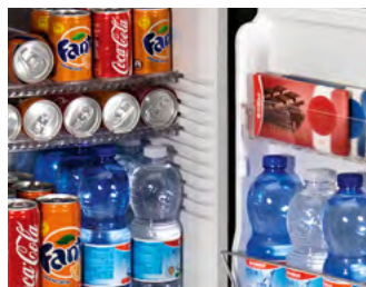
Comodi ripiani e balconcini Practical shelves and balconies