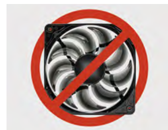
Senza ventole interne o esterne Without internal or external fan