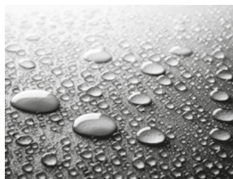
Sigillatura speciale con resina eposi (lunga durata) / Special sealing with epoxy resin (long lasting)