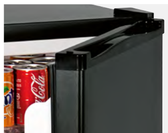
Porta reversibile Reversible door